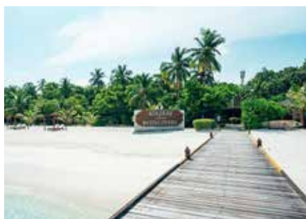
Hotel Adaaran Select Meedhupparu