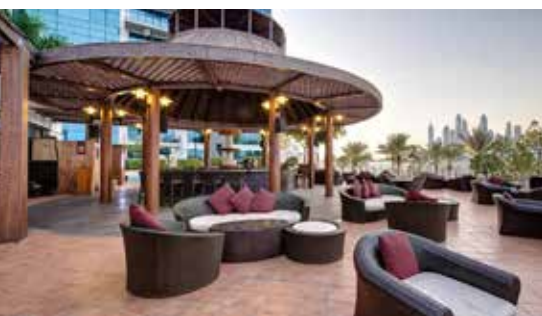
Hotel Dukes The Palm

Elegant ausgestattete Zimmer, mit ihrer warmen Einrichtung, bieten ausgiebigen Platz zum Entspannen. Die klimatisierten Villen sind komplett ausgestattet mit modernen Annehmlichkeiten wie eine eigene Minibar, Satellitenfernsehen, Direktwahltelefon und eigenem Safe.