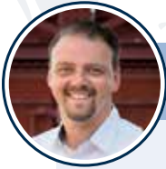
Kai Weiffen Projekt Deutschland Dental

Unser Partner Projekt: Deutschland Dental hat eine Dental-Ausstellung und einen Vortrag für Sie vorbereitet.