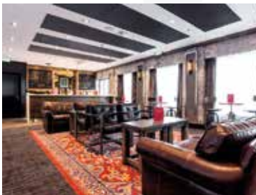
1 Studio Bar