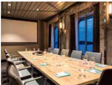
2 Konferenzraum Reederei