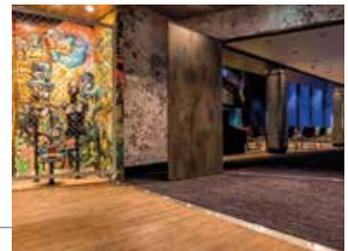
4 Foyer Studio